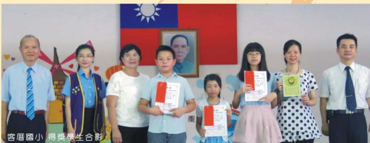
客厝國小 得獎學生合影