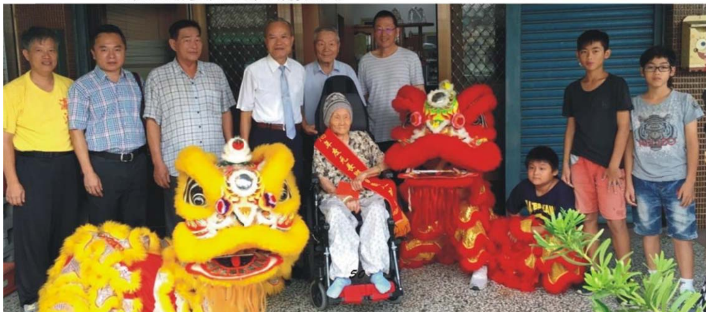
元長鄉公所重陽節百歲人瑞慶祝活動

我也因為閱讀這本書，而我了解可以用及時的愛來面對、克服死亡帶來的分離與悲痛，我希望自己也能用及時的愛表達、接受無可避免的老、病、死，也希望能夠有勇氣，天天跟爸爸、媽媽說「我永遠愛你」，珍惜跟家人、朋友在一起的每一分、每一秒，畢竟愛要及時，自己如果能夠用更成熟的態度來面對世界，自己也會更加進步了呢！