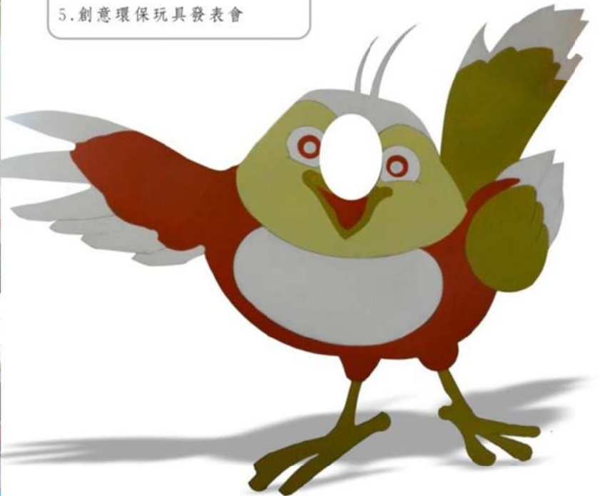
立體鳥形立牌提供來賓拍攝紀念