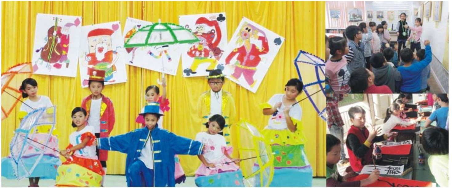
元長國小藝術走秀活動歐洲宮廷舞表演