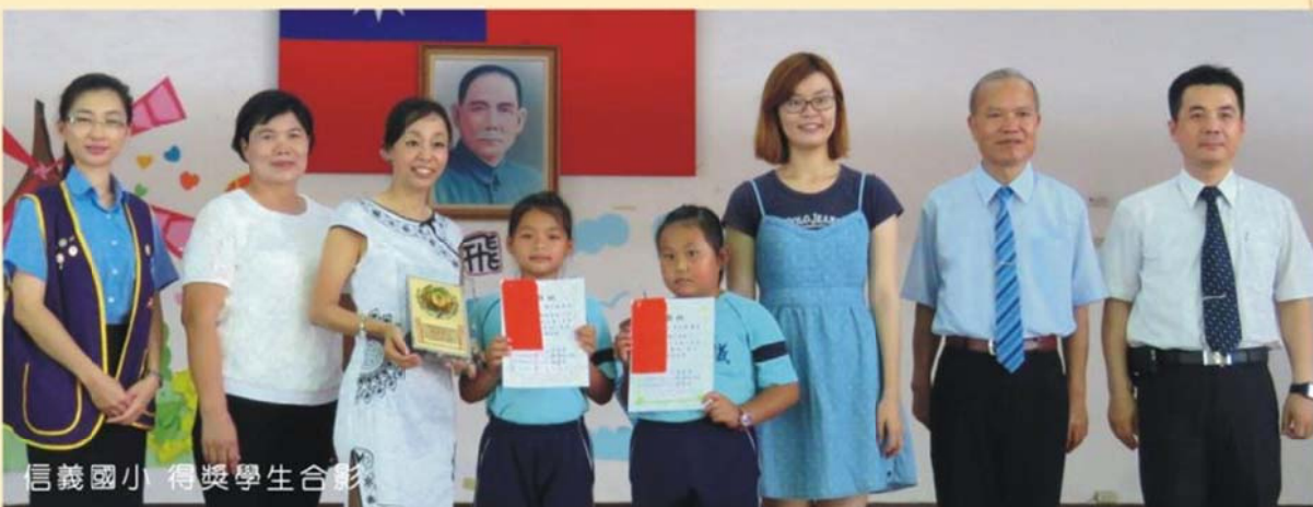
信義國小 得獎學生合影