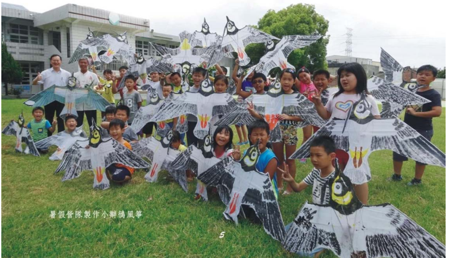
暑假營隊製作小鸚鵡風箏

除此之外，不斷的寫作練習，才是寫作力精益求精的不二法門。感謝日友環保企業，為元長鄉的孩子開闢一個這麼美好的練習園地，讓孩子們能夠在這裡盡情的揮灑。相信肯在此辛勤筆耕的學子，將來有一天必能在寫作之路上，歡笑收割。