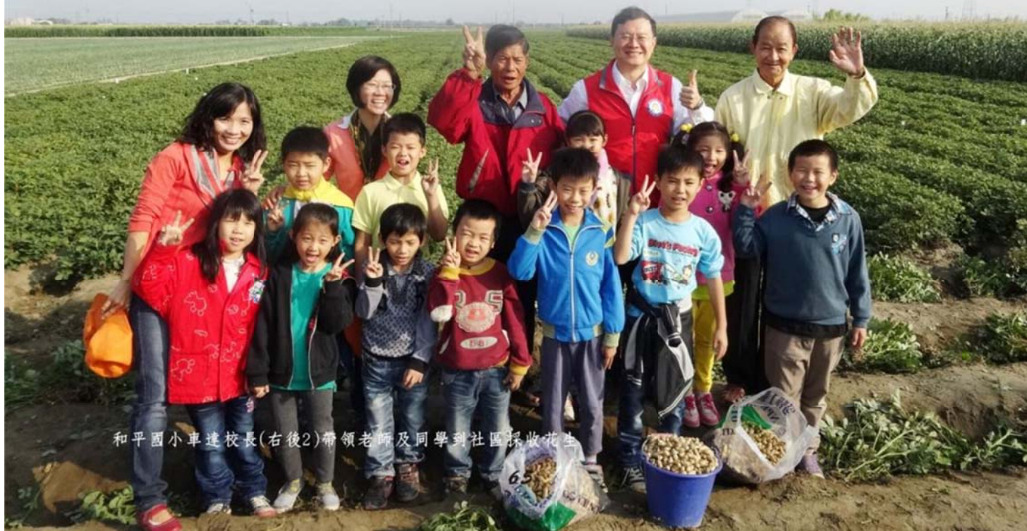
和平國小車達校長(右後2)帶領老師及同學到社區採收花生

不過我喜歡這本書還有一個小祕密哦，因為螞蟻老師發表新書那天，也是學校安排我們DIY製作土豆糖的日子。每次我讀這本書就會想起當時的情景——我拿著重重的鍋鏟翻動花生，就能聞到濃郁的香氣，充滿整個鼻子；看到老師把花生和麥芽糖漿混合在一起，接著仔細的鋪平在大盤子裡，再拿起像半圓形的船刀把它切成小塊，我的口水都快流下來了。花生糖真得好好吃，尤其是我們自己做的，不但嘴巴吃得香甜，就連記憶也充滿幸福呢。