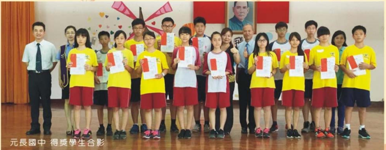
元長國中 得獎學生合影