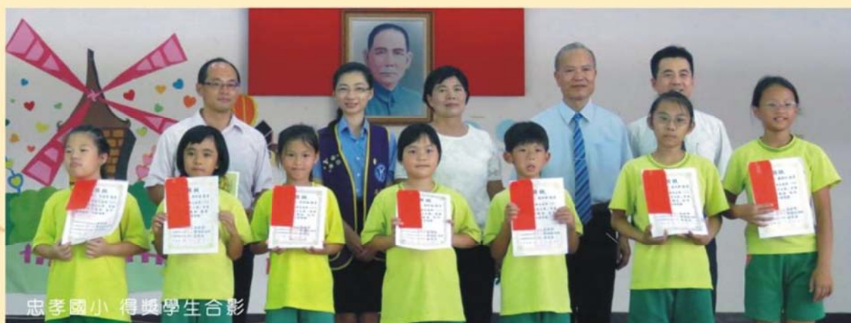
忠孝國小 得獎學生合影