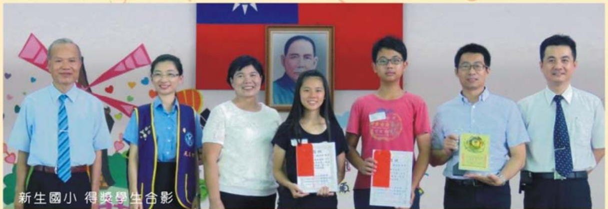
新生國小 得獎學生合影