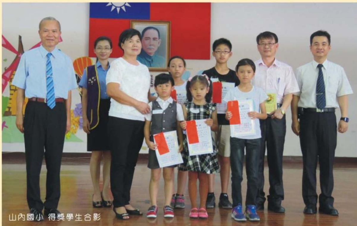
山內國小 得獎學生合影