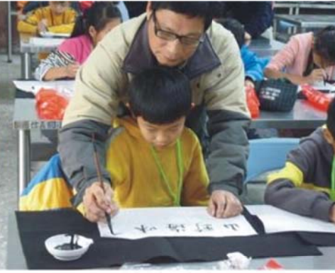
假日才藝營寫書法