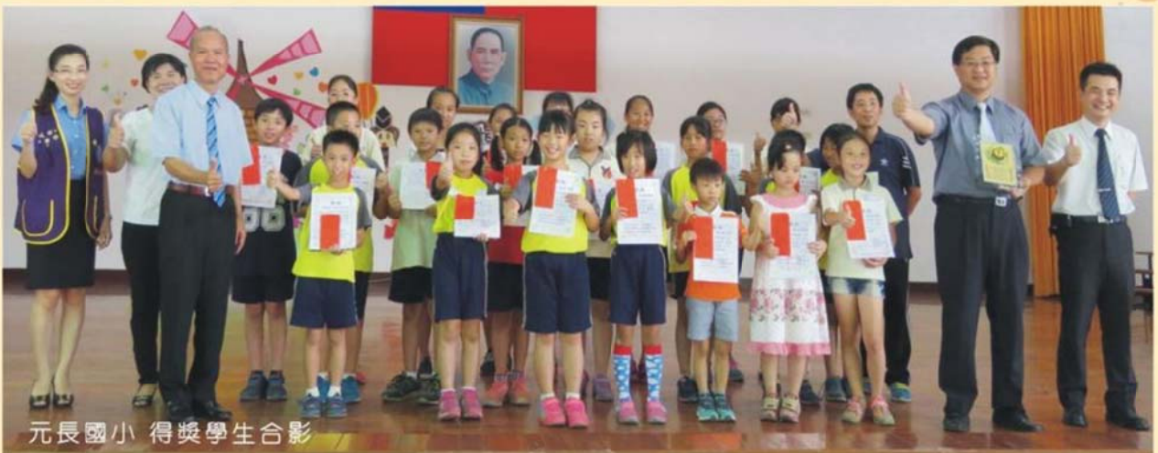
元長國小 得獎學生合影