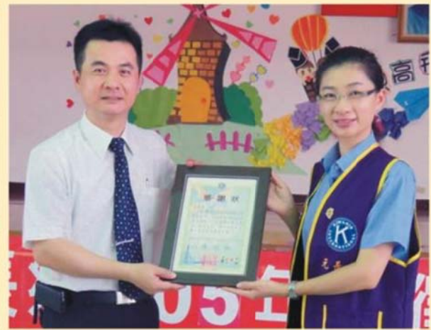
元長國際同濟會致贈日友公司感謝狀