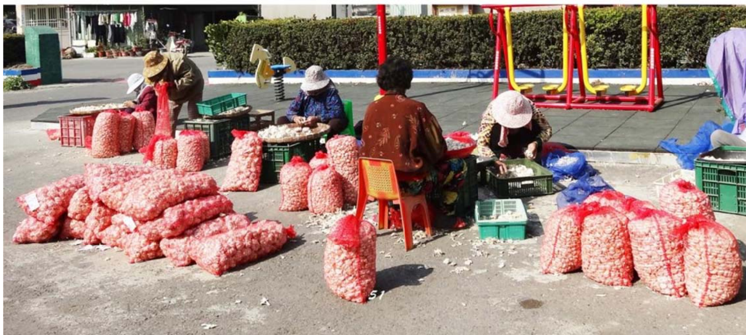
西莊社區活動中心廣場農忙

在這個村莊裡，也有許多好玩又有趣的景點和古蹟，例如：吳家古厝、紅毛井……等等。假日時，常有許多外地的遊客來參觀我們蘊含人文的古蹟和宜人的美景，西莊村真是太美了！可惜的是，現在村裡多了幾間有機肥料工廠，這些工廠在運作時，會有怪味、臭味傳出來，甚至還排放汙水和髒空氣，破壞了村莊原本的美好，希望這些肥料工廠可以改善，如果改善了，我們的村莊就可以和以前一樣優美，讓來到這裡的遊客回味無窮！