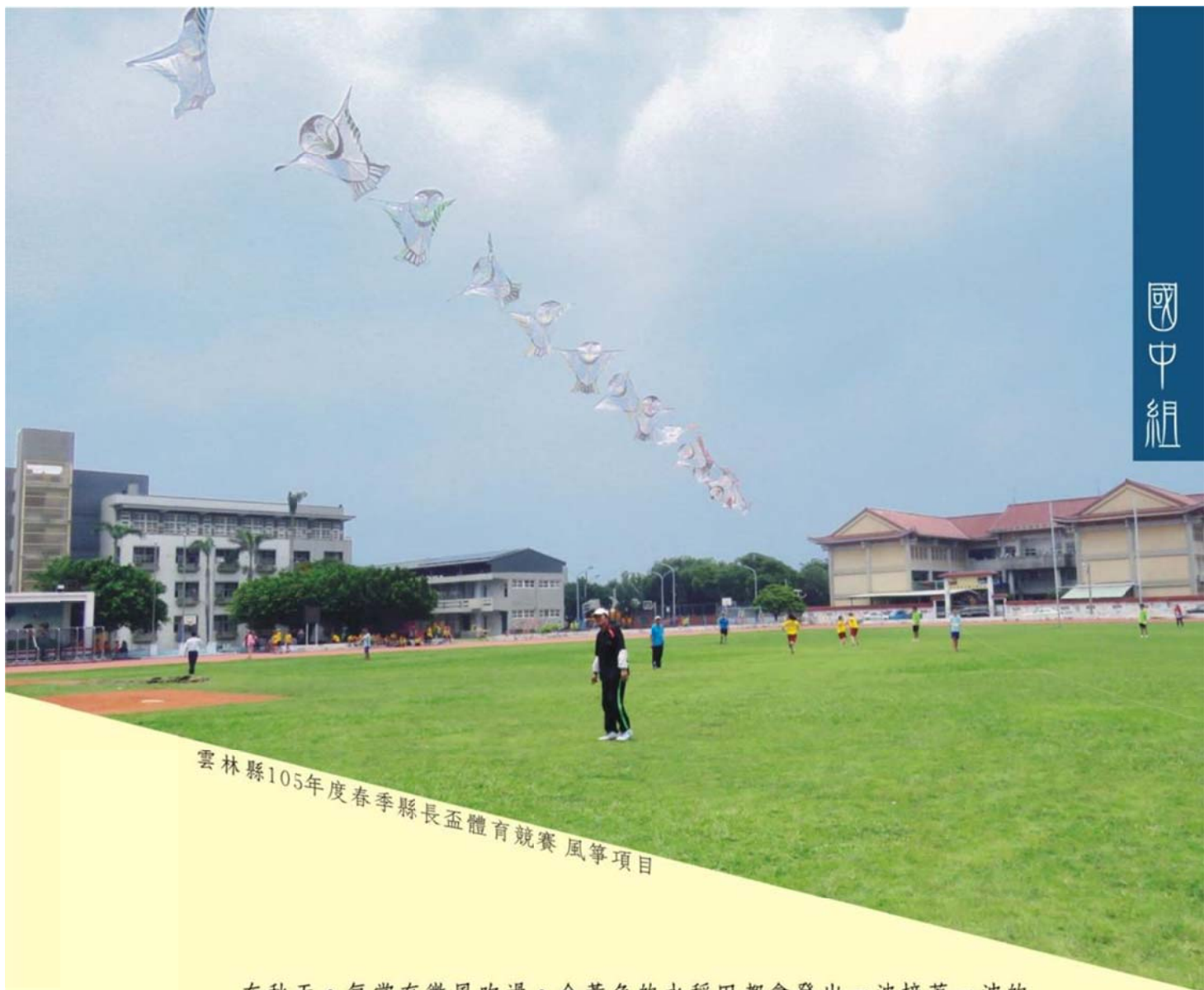
雲林縣105年度春季縣長盃體育競賽風箏項目

在秋天，每當有微風吹過，金黃色的水稻田都會發出一波接著一波的「沙—沙—」，就像是一首首美妙的沙鈴詩，我喜歡在這涼爽的溫度中去踩著落葉，「咔咔咔」不知怎麼的這聲音越聽越開心，偷偷告訴你，這是最愛；秋天就像悠遊自在的演奏者。