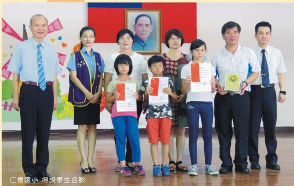
仁德國小 得獎學生合影