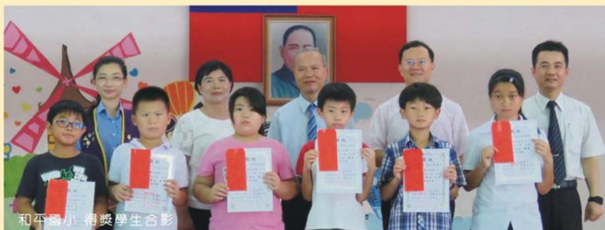
和平國小 得獎學生合影