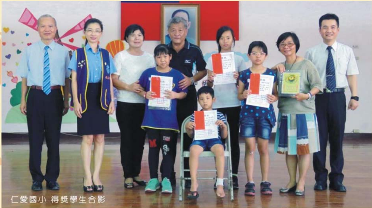
仁愛國小 得獎學生合影